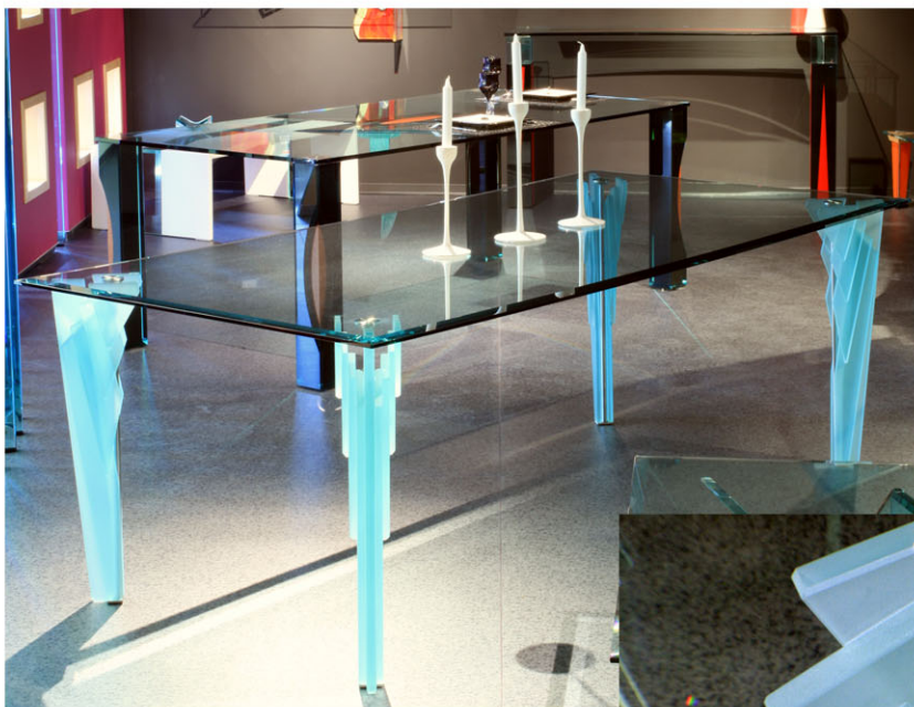
Table avec pieds dépolis