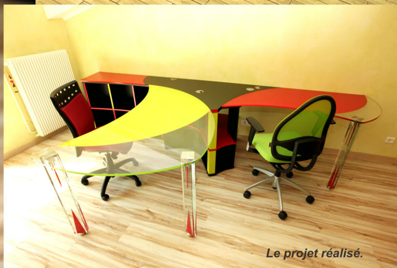
Le projet réalisé.